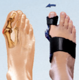
Ángulo ajustable del Hallux valgus

Como la ValguLoc® II de Bauerfeind corrige la desviación del dedo gordo, la articulación se ve descargada y los dolores se mitigan. La ValguLoc® II puede llevarse en un calzado cómodo durante el día y la noche.